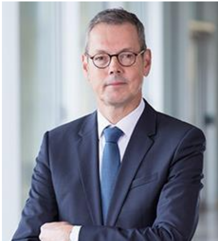
Prof. Dr. Peter Bofinger Sachverständigenrat des Deutschen Bundestags